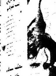
موسى يامل في تطور ايجابي للعلاقات المصرية الابرانية